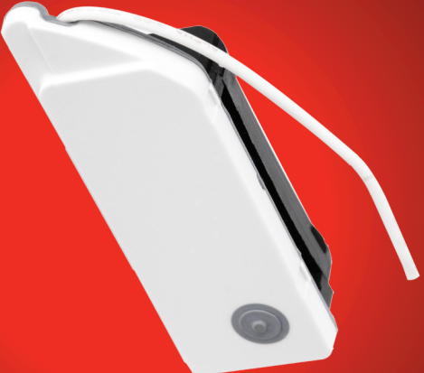
Bezdrátový modul XW100

Instalační prostor modu- lu bezdrátové komunikace